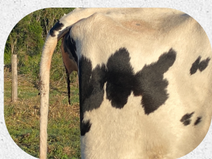
Pérdida de tapón mucoso