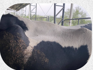
Relajación del canal de parto